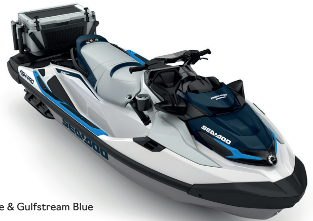
White & Gulfstream Blue